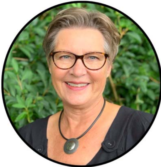
Kunstner: Susanne I. Frederiksen

Her kan du/I se en masse malerier, samt få mulighed for at stille spørgsmål til teknik, farvevalg og udtryk.