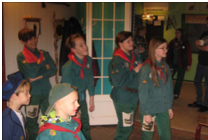
Der er altid noget godt i vente hos Tybjergspejderne

Alle er velkommen til at komme og se, hvad det vil sige at være spejder hos Tybjergspejderne.